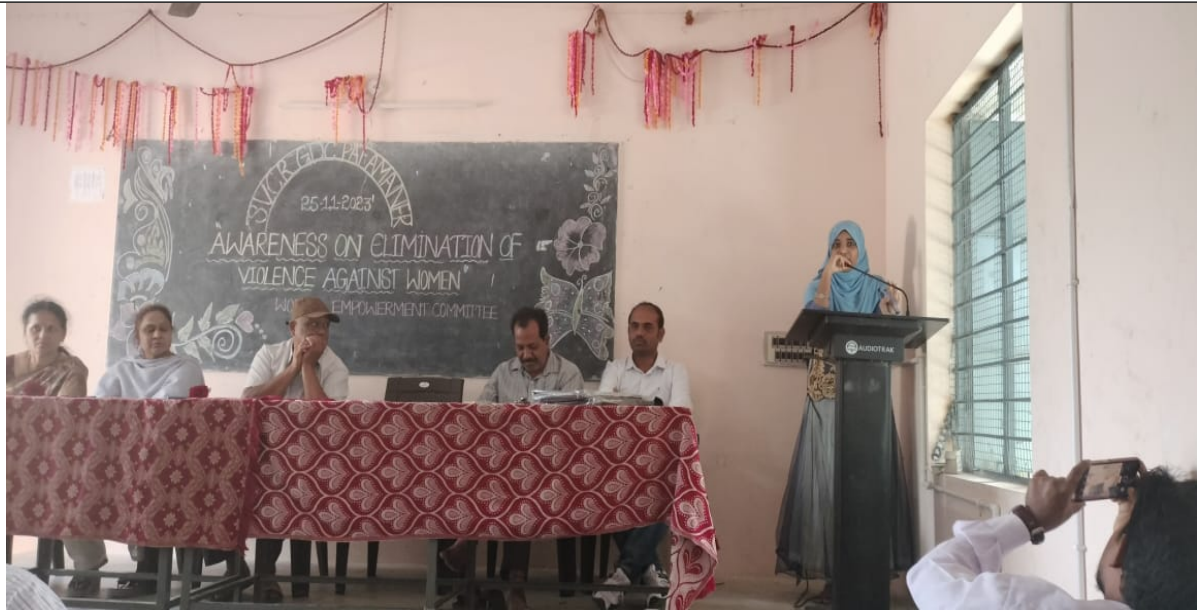
Message by student