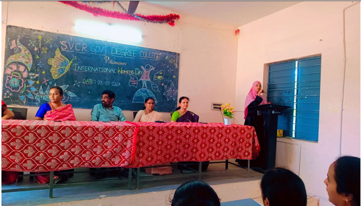
Message by students